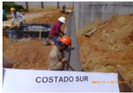
Acondicionamiento de terreno para evacuación de aguas superficialescostado orientalY COSTADO SUR