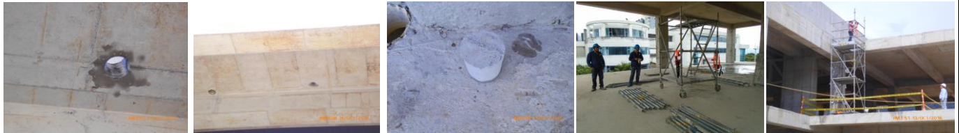
Extracción de núcleos para bajantes sanitarios