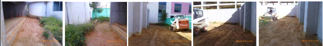
Conformación de rellenos en áreas externa transición